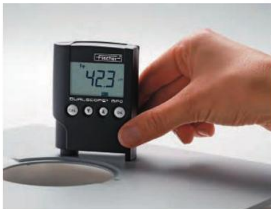
测量铁上油漆的厚度