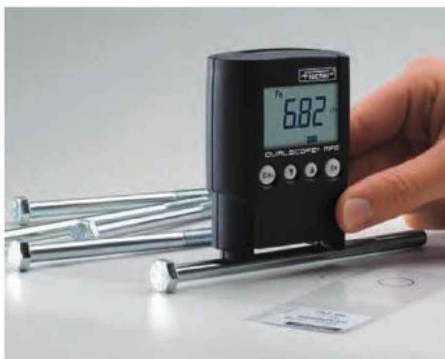
测量铁上镀锌层的厚度，测量小曲率工件必须进行校准以获得准确的测量结果