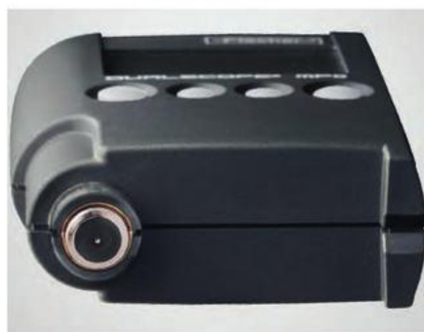
表面有硬质镀层的内置探头，底座和探头处配以V型凹槽，可测量圆柱形工件。

操作手册有多种语言可选。 保护罩（订货号：603-582）可供选择。 *也作为替换件供选择