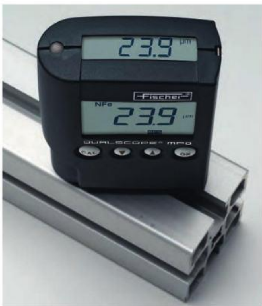
测量铝上阳极氧化膜的厚度